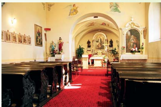
Kostol po poslednej rekonštrukcii v rokoch 1992 - 1993 A templom a legutóbbi, 1992-1993-as rekonstrukció után The church after the most recent reconstruction completed in 1992 - 1993