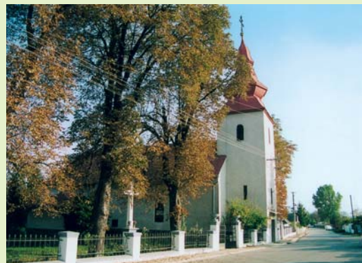
Rímskokatolícky kostol zasvätený Nanebovzatíu Panny Márie A Szeplőtelen Szűz Mária r.k. templom A Roman Catholic Church devoted to the Virgin Mary's ascension to heaven