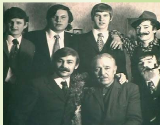
Zachovaný záber na členov ochotnickeho divadla Az amatőr színjátszókéről fennmaradt kép A preserved picture of members of an amateur theatre

The town got into the history of railway transport also. The first train crossed the area on July 5th, 1860. It left Miskolc and its destination was Košice. According to records in the chronicle, theatre and a singers' club had their traditions in the town as well. A voluntary fire brigade in the town actively worked particularly in the first half of the 20th century.