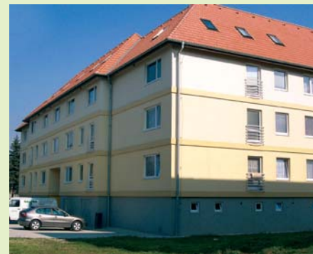
Nový 40-bytový komplex postavený pre mladé rodiny • Az új, fiatal családok számára épült 40-lakásos lakóház • A new 40-unit housing complex, built for young families

Väčšinu projektov obec zrealizovala prostredníctvom vlastnej stavebnej spoločnosti Poľnohospodársko-stavebná výroba obce Kechnec, s.r.o. Okrem ekonomického prínosu má stavebná spoločnosť pozitívny vplyv aj na znižovanie nezamestnanosti, nakoľko jej zamestnancami sú práve nezamestnaní obyvatelia z obce Kechnec.