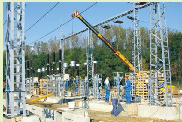
Nová elektrická stanica Új villanytelep New electric station

Výstavba závodu GETRAG FORD Transmissions A GETRAG FORD Transmissions üzem építése Construction of the GETRAG FORD Transmissions plant