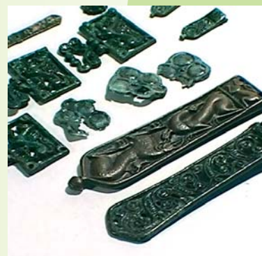
Ozdoby zo slovansko - avarských hrobov Szláv és avar sírokból származó díszek Ornamental fittings from Slav - Avar graves