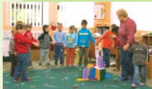
Deti v materskej škole v Kechneci A kenyheci óvodások Children in the Kechnec kindergarten

Integrovaná európska škola v Kechneci bude príležitosťou rovnako pre slovenských občanov, ako aj obyvateľov blízkej Maďarskej republiky. Vzdelanie bude poskytovať aj pre rodiny zahraničných investorov, ktoré hľadajú vyučovanie v nemeckom alebo anglickom jazyku.