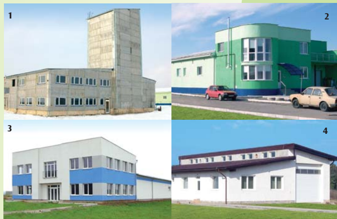
Slovenskí investori v parku: 1- JISIMEX, 2 - Dorsvet Plus, 3 - Evans, 4 - Imrich Čamaj Szlovák befektetők a parkban: 1 - JISIMEX, 2 - Dorsvet Plus, 3 - Evans, 4 - Imrich Čamaj The Slovak investors in the park: 1- JISIMEX, 2 - Dorsvet Plus, 3 - Evans, 4 - Imrich Čamaj

Nearing completion is a hairdressing and beauty salon in the new apartment complex and a food store. The citizens will soon enjoy a bank, a dry cleaner, an electric appliances repair service, and a shoe repair shop which will be located in the new Service Center.