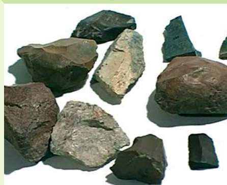
Nástroje z doby kamennej Kőkorszaki munkaeszközök Tools from the Stone Age