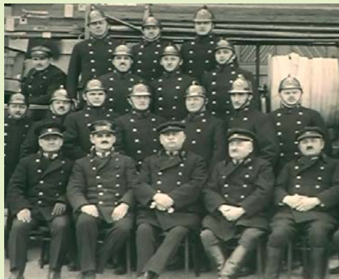
Dobrovoľný hasičský zbor Az önkéntes tűzoltók énekara A voluntary fire brigade