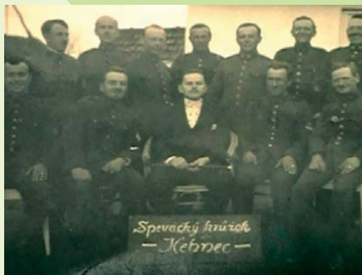
Spevácky krúžok v Kechneci A kenyheci énekkar A singers' club in Kechnec

Obec sa zapísala aj do histórie železničnej dopravy. Prvý vlak prešiel chotárom obce 5. júla 1860. Vyšiel z Miškovca a cieľovú stanicu mal v Košiciach. Podľa záznamov v kronike malo tradíciu v obci aj divadlo a spevácky krúžok. Dobrovoľný hasičský zbor v obci aktívne fungoval najmä v prvej polovici 20. storočia.