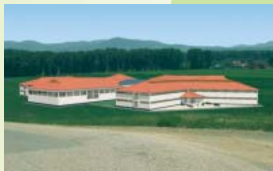
Integrálnu európsku školu plánujeme postaviť v južnej časti katastra obce Kechnec. • Az integrált európai iskola építését Kechnec déli részén tervezzük. • We are planning to build the Integrated European School in the southern part of the Kechnec cadastre.

The Integrated European School in Kechnec will provide opportunities for citizens of Slovakia as well as neighboring Hungary. Further, it will provide education for families of foreign investors that require education in German or English.