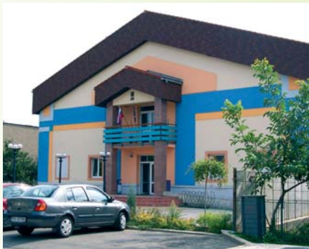
Obecný úrad po rekonštrukcii a prístavbe kongresovej sály • A felújított helyi hivatal a hozzáépített kongresszusi központtal • The Municipal Office after the reconstruction and the addition of a congress hall