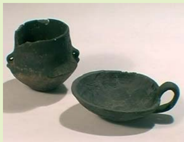
Nádoby z neskorej doby bronzovej Bronzkori edények Containers from the Bronze Age