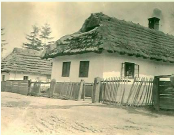
Starý dom z obdobia okolo roku 1900 Régi ház 1900 körül An old house in around 1900

Községünk a németek bevonulásakor eredeti, szláv nevével viselte, amelyet a németek átvettek. Hivatalos magyar névként azonban a Felnémet elnevezést kapta. 1560-ban Kenyhecz Nempty néven szerepelt, 1605 Kenyhecz-ként, 1808-ban pedig Kechnec, amely megnevezés máig használatos. Egyházi eredetű dokumentumok alapján Kenyhecen 1746-ban szlovákul és magyarul beszéltek, csakúgy, mint manapság. A község akkori jelentőségét bizonyítja az az adat is, mely szerint egy fontos kereskedelmi útvonal vezetett keresztül rajta, a Budai, avagy Pesti út. Ez azonban gyakorta szolgált hadi útvonalként is.