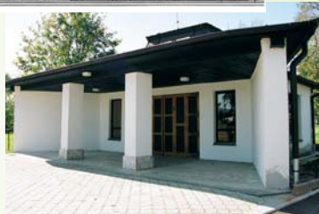
Dom smútku – v súčasnosti v rekonštrukcii Ravatalozó A cemetery house – currently under reconstruction